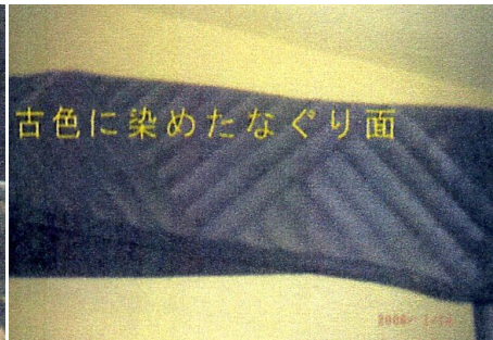
琉球タタミの和室